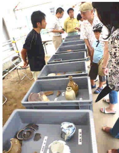
出土物を熱心に見る人たち