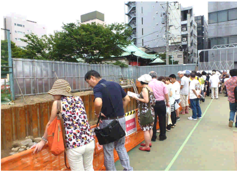
伝馬町牢屋敷跡遺跡の見学会に訪れた人々。身延別院本堂の屋根も見える

中央区教育委員会の発表資料によると、正式な遺跡名は「伝馬町牢屋敷跡遺跡」。牢屋敷は、徳川家康の入府当初の天正十八、十九年頃は今の日本銀行あたりに置かれていました。伝馬町に移転したのは慶長十八年(一六一八年)頃からといわ