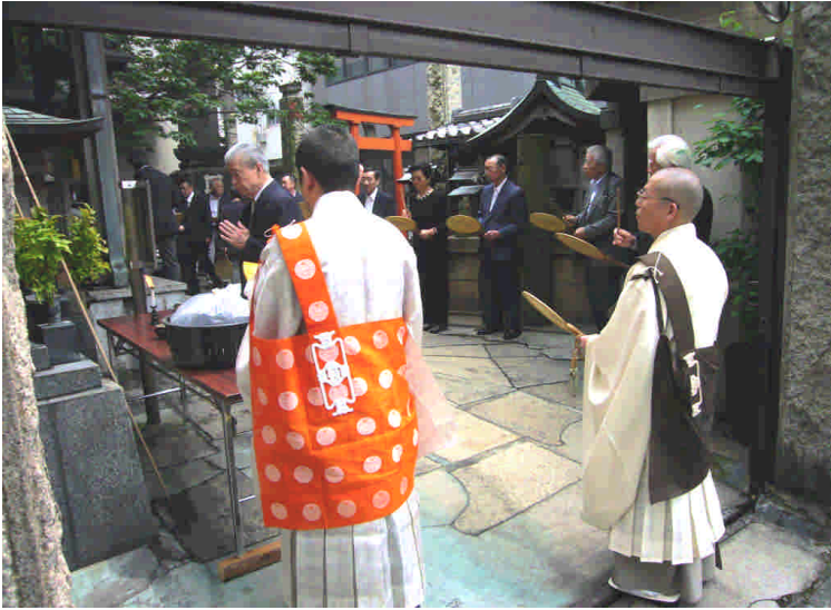
副住職らが見守る中、焼香をする組合の皆さん

組合の皆さんは本堂で法要を行った後、境内にある「鰻塚」の前で焼香をしました。鰻塚は、組合傘下の十八の店が昭和五十八年四月三日に建立した供養塔です。焼香の後、組合の皆さんは日本橋川まで移動し、鰻を放流しました。