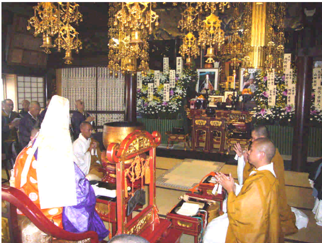
身延別院本堂で行われた法要