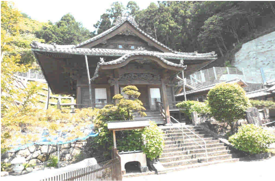
「生身」のお祖師様をまつる法華寺の祖師堂