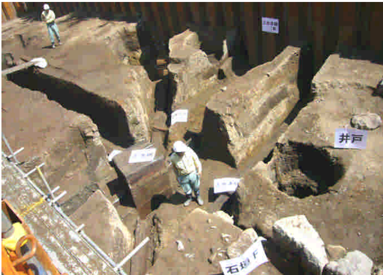
上水道の跡が次々に発見され、発掘担当者を驚かせた。四角い箱は上水枿

れ、その後は江戸時代を通して牢屋敷であった土地です。この間、実に十六回もの火災に遭ったとされています。